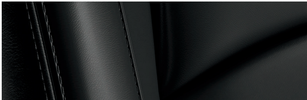
Versión i Grand Touring y Signature