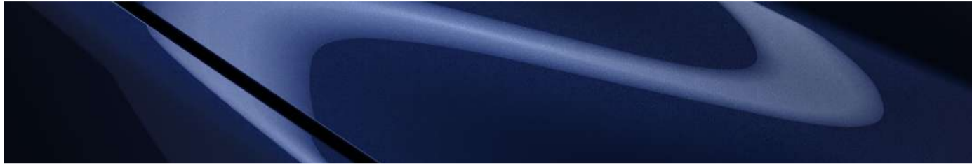
Azul Marino Profundo