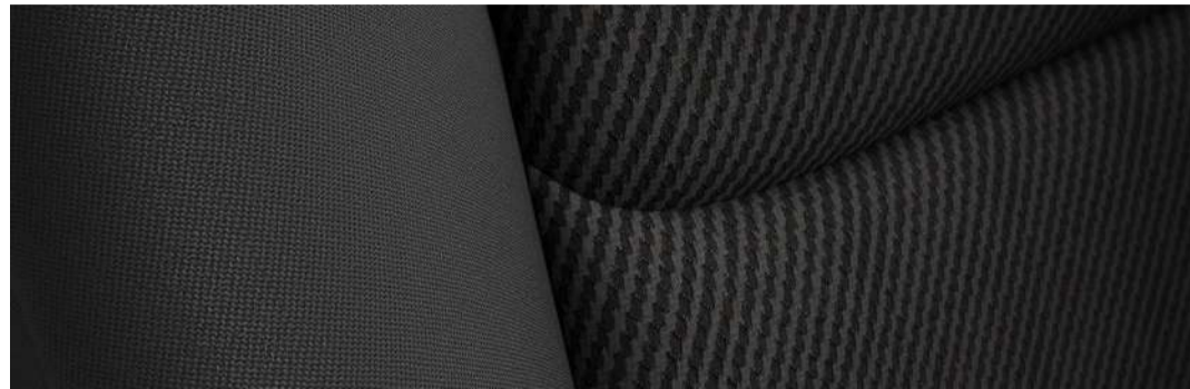
Versión i, i Sport