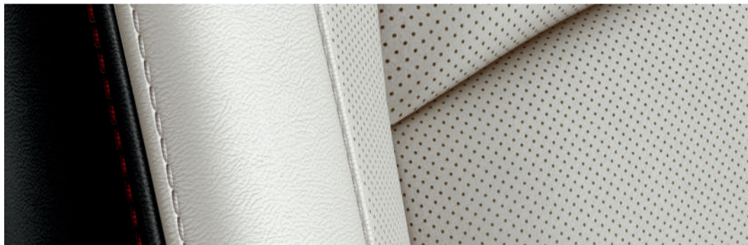
Versión i Grand Touring y Signature