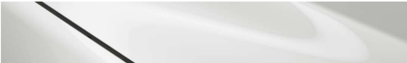
Blanco Aperlado Mica