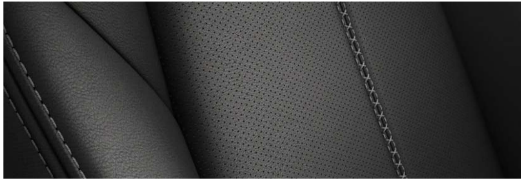
Versión Signature AWD