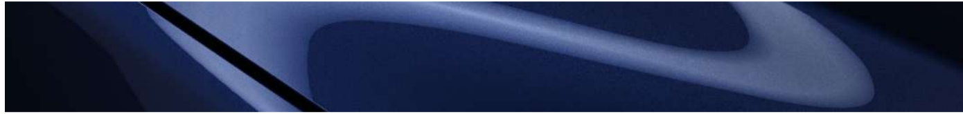
Azul Marino Profundo