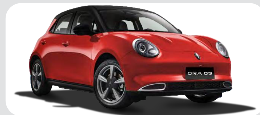
Rojo / Negro