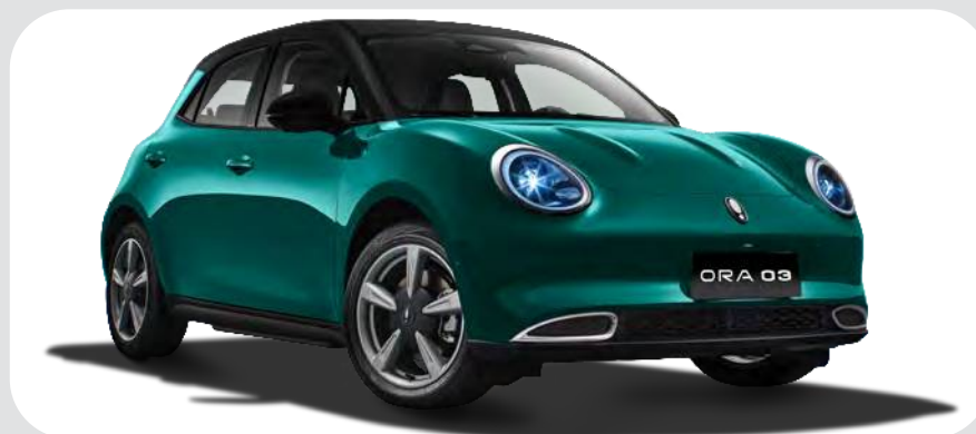
Verde / Negro