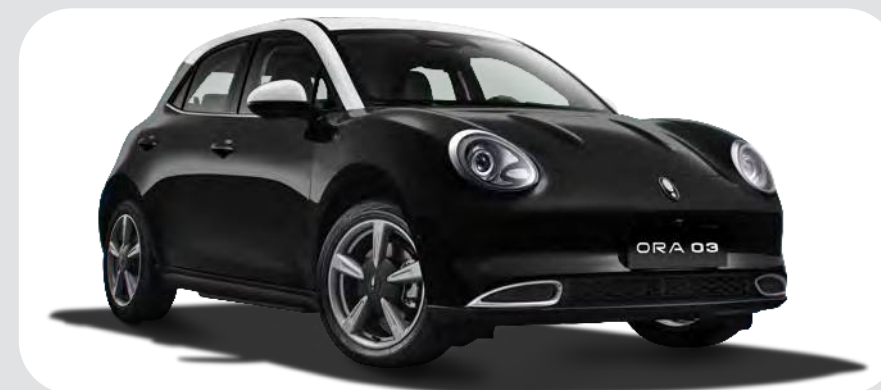
Negro / Blanco