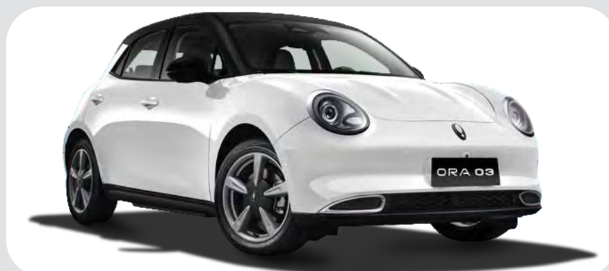
Blanco / Negro