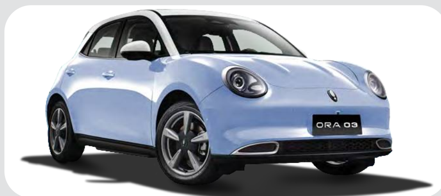
Azul / Blanco