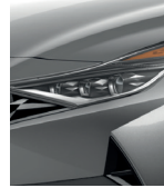
Metal fluido (M6T)