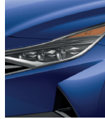
Azul intenso (YP5)