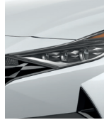
Blanco polar (WAW)